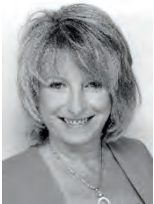
Christine Roth Ehrenamtliche Fotografin